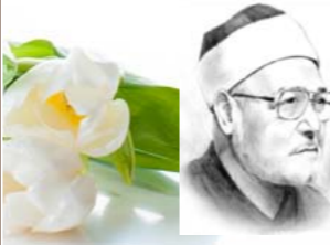
الشيخ العلامة محمد الغزالي -رحمه الله-

- العدل: استخدم عثمان العدلَ مع رعيته، وفي البلاد التي فتحها، وتروي مراجع تاريخية أنه ولي القضاء في مدينة (قرة جه حصار) التركية، وذلك بعد الاستيلاء عليها من البيزنطيين في عام (١٢٨٥م)، وأنَّ عثمانَ حَكَمَ لبيزنطيَّ نصرانيَّ ضدَّ مسلم تركيَّ، فاستغرب البيزنطيُّ؛ وسأل عثمان: كيف تحكم لصالحه وأنا على غير دينك؟! فأجابه عثمان: بل كيف لا أحكم لصالحك، والله الذي نعبد، يقول لنا: {وَإِذَا حَكَمْتُمْ بَيْنَ النَّاسِ أَنْ تَحْكُمُوا بِالْعَدْلِ} [النساء: ٥٨]؛ فاهتدى الرجل وقومه إلى الإسلام.