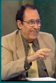
د. فاضل صالح السامرائي باحث في الإعجاز البياني في القرآن