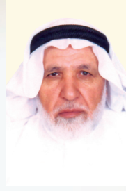
إعداد: الشيخ عبد الرحمن جبريل

١٦٩٨م، ثم ظهرت أول طباعة إسلامية خالصة للقرآن الكريم في سانت بترسبوغ بروسيا سنة ١٧٦٧م، ثم ظهر مثلها في قازان، ثم قدمت إيران طبعتين إحداهما في طهران سنة ١٨٢٨م والأخرى في تبريز سنة ١٢٤٨هـ الموافق ١٨٣٣م.