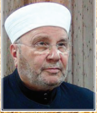
أ.د. محمد راتب النابلسي